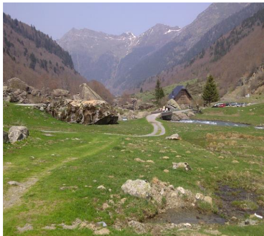
Un séjour en bordure du Parc national des Pyrénées